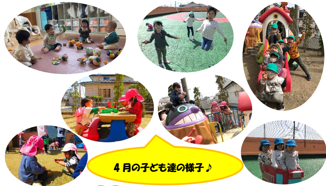
4月の子ども達の様子♪

入園、進級から一ヶ月が経とうとし、子ども達は新しい環境、新しい先生に少しずつ慣れてきている様子が見られています。まだまだ慣れずに泣いてしまったり、不安に感じたりしてしまう姿もありますが、一人一人と丁寧にに関わり、園で楽しんで過ごしてもらえるようにしていきたいと思ひます。